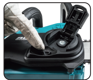
調節盤「-/+」 釋放 / 鎖緊鏈條