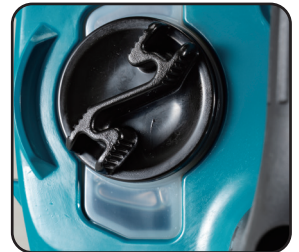
油位視窗 方便檢查油位