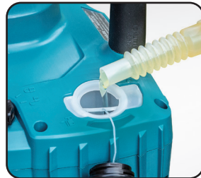
大油箱蓋 方便添加鏈條油