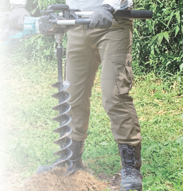
① 鑽數個洞鬆開土壤