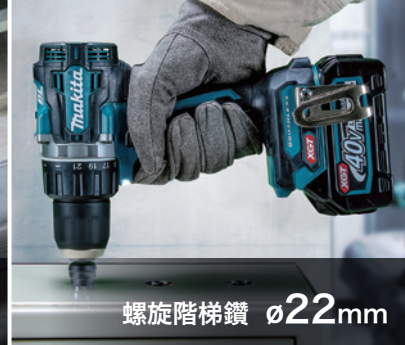
螺旋階梯鑽 \phi 22mm