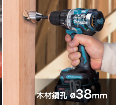
木材鑽孔 \phi 38mm