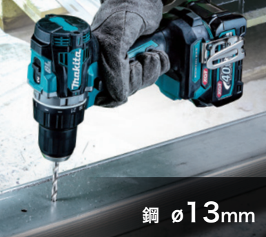
鋼 \phi 13mm